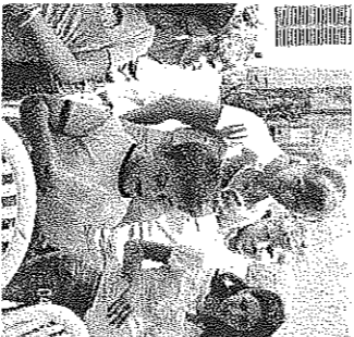
MONTICELLI - Un bambino legge una filastrocca alla festa del Piedibus