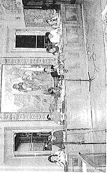
LUGAGNANO - La giunta comunale: rinviata la decisione sul contestato supermercato