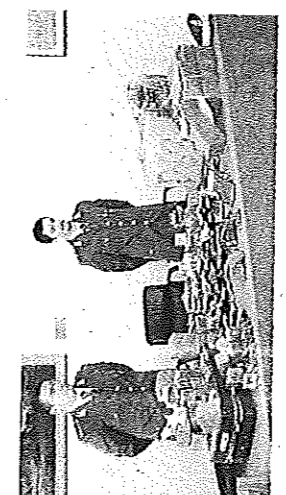
I finanziari con l'hascisc sequestrato

Cremona. Marocchino cella, chiuso un rubinetto dello spaccio Preso con 200 chili di hascisc CREMONA — Un marocchino finito oltre le sbarre, sequestrati quasi due quintali di hascisc per un valore sul mercato di 400mila euro. L'operazione è stata messa a segno dal Nucleo di polizia tributaria di Cremona, coordinato dai sost.