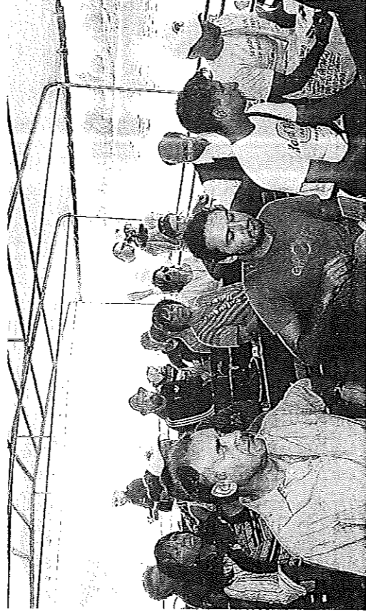
Un momento della navigazione sulla Cicogna e l'imbarco avvenuto a Cremona