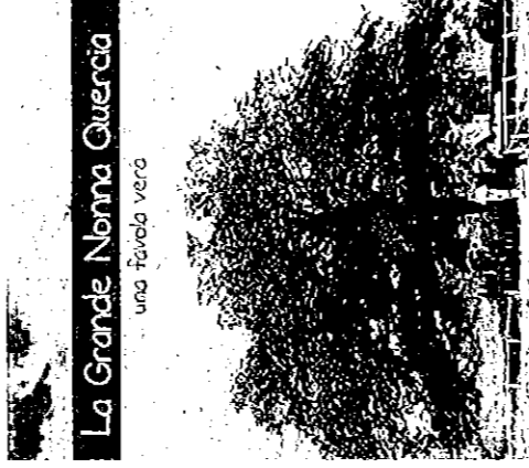
La Grande Nonna Quercia